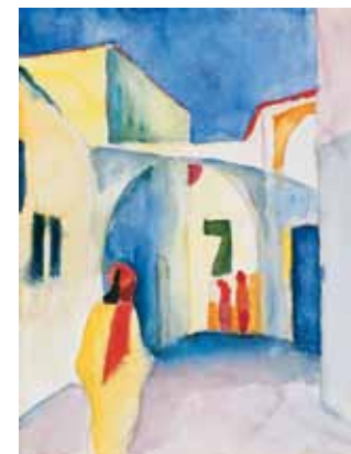
August Macke: Blick in eine Gasse, 1914

Dauer: 150 / 180 Min Kosten: 4 € pro Schüler inkl. Eintritt und Material