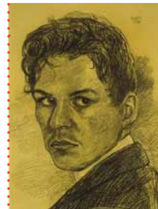
Otto Pankok: Selbstbildnis, Kopf n.L., 1909 © Eva Pankok

Dauer: 150 Min inkl. Praxisteil | Zielgruppe: Sekundarstufe I und II Kosten: 4 € pro Schüler inkl. Eintritt und Material