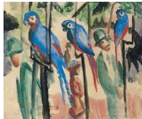
August Macke: Bei den Papageien, 1914

Dauer: 120 Min inkl. Praxisteil | Zielgruppe: Kindergarten, Primarstufe Kosten: 2 € pro Kind inkl. Eintritt und Material